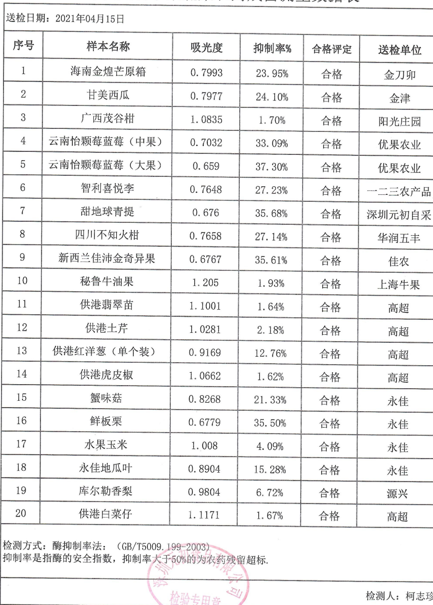
深圳元初水果蔬菜农药残留测量数据表