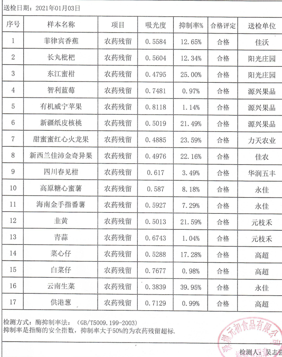
深圳元初水果蔬菜农药残留测量数据表